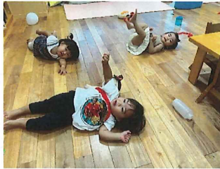
朝の体操あそびが大好きです♪