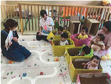
電車の中で絵本を見ています♪