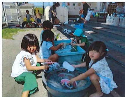
自分の靴を洗ったよ♪