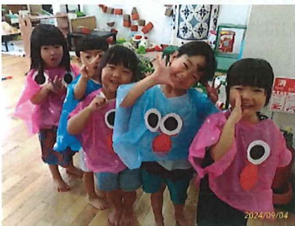
可愛いおばけ、作りました