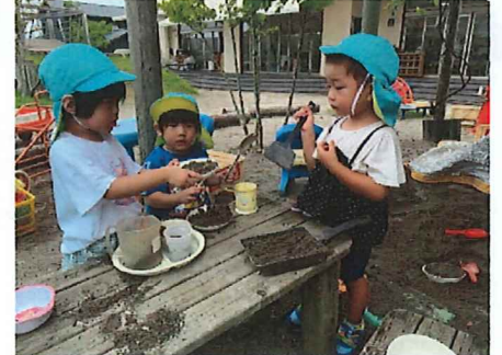
久しぶりの砂場あそび楽しいね