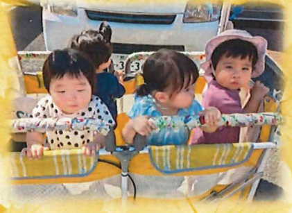
お散歩気持ちいいね♪