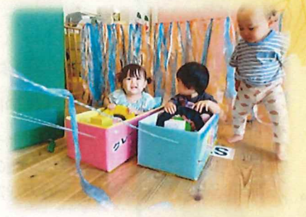
スイーツカーに乗ったよ♪