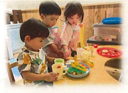
ランチプレートの出来上がり♪