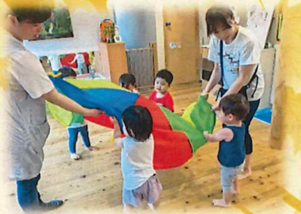
みんなで息を合わせてバルーンあそび☆