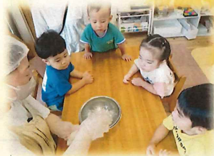
防災の日にお米とぎに挑戦！