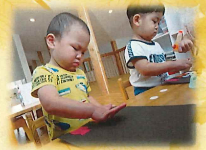
お月見製作をしたよ☆