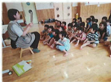
真剣に紙芝居を見ている