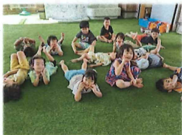
第二園庭楽しいね