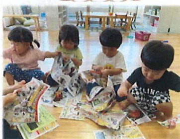
ビリビリできるよ