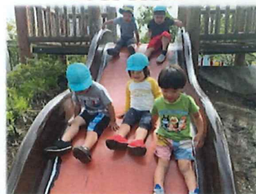
一緒にすべると楽しいね