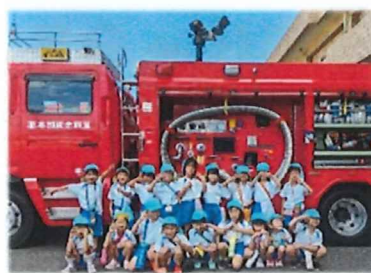
消防署見学に行ったよ