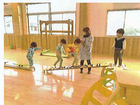
順番を守って楽しく遊べるよ

今月の保育料の引き落としは 1月27日(月) です。前日までに、ご確認をお願いします。