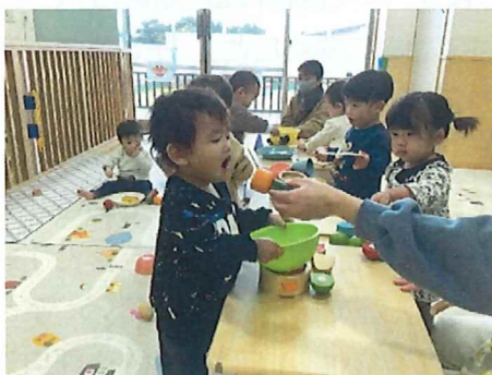
ままごと遊び楽しいね