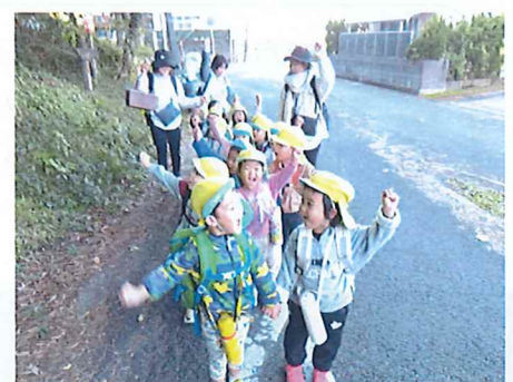
初めての登山がんばるぞー！ 元気なさくら組さん