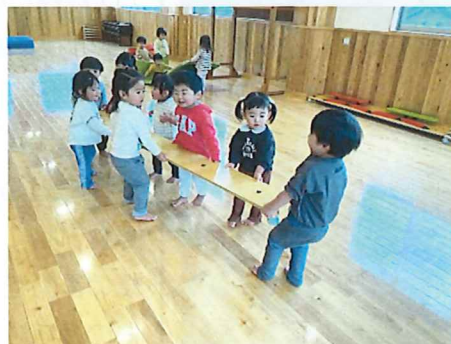
片付け自分たちでできたよ