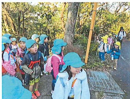
ひまわりさんと合流♡