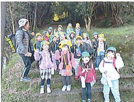
今年もがんばるぞー！